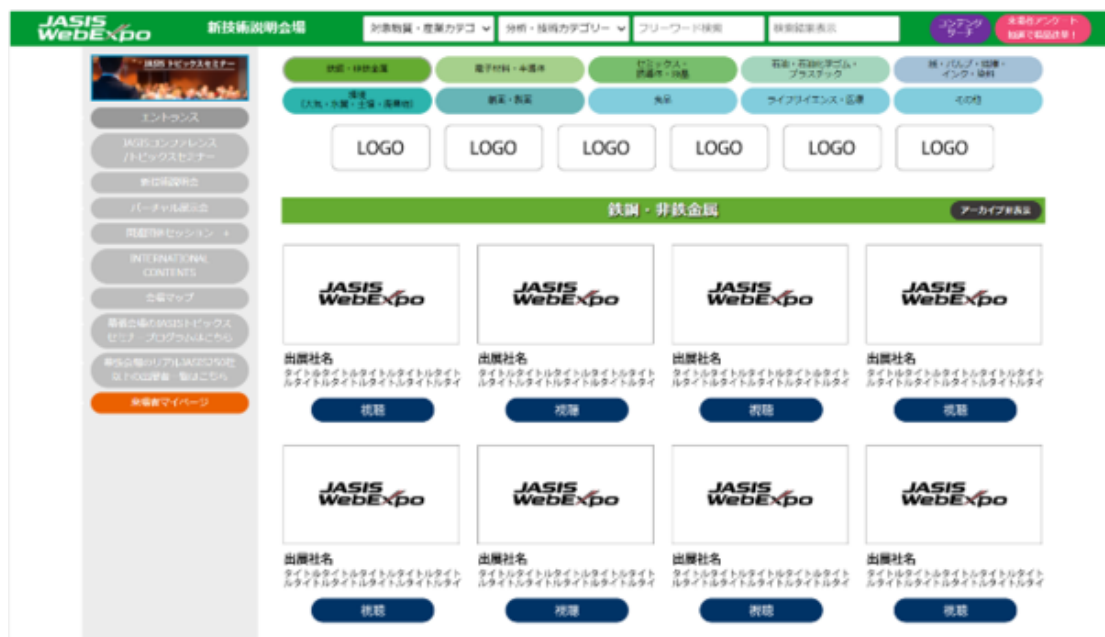
出展社の動画サムネイル一覧

新技術説明会の会場(ページ)は、目的のセッションにスムーズにたどり着けるよう、出展社の動画サムネイルを一覧で表示し、視認性と操作性を高めた作りとなっています。