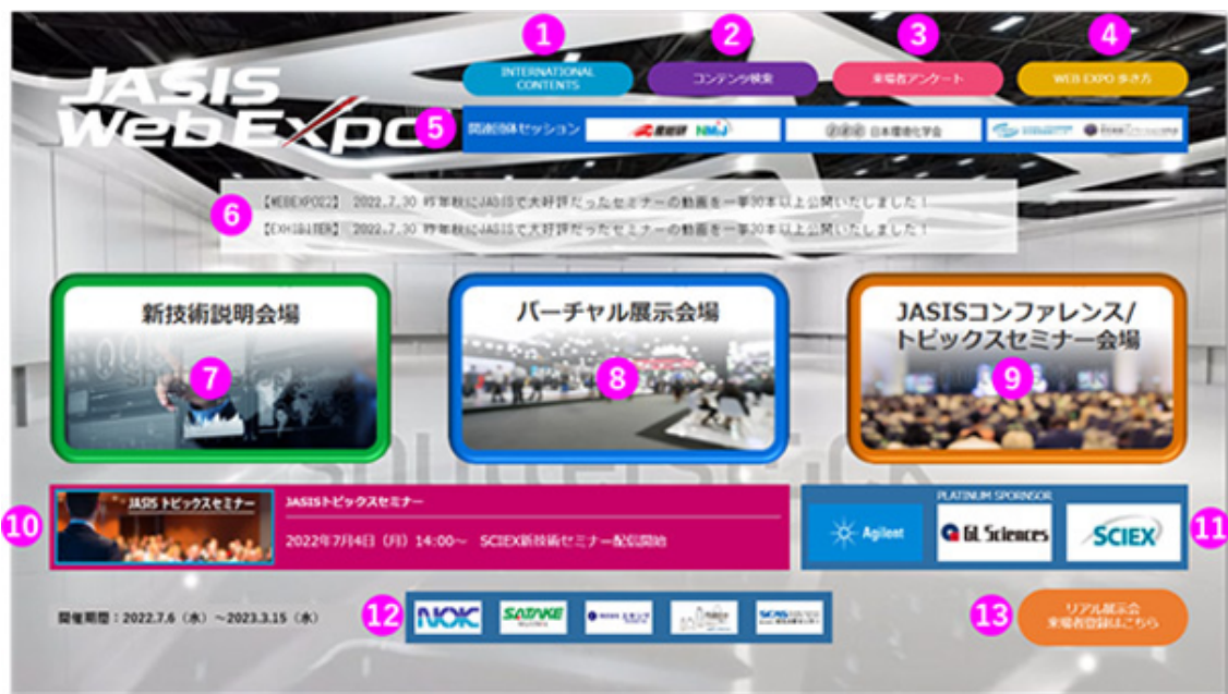
エントランスイメージ

前回は 11,000 名以上がアクセスし、延べ約 110,000 回のコンテンツ閲覧が記録されたほか、JASIS 2021 に来場していない方々約 7,000 名が閲覧に訪れるなど、「250 日間、どこからでも」参加できる新しい形の展示会として、分析・科学機器のユーザーにとって便利な情報収集の場となっていると言えます。